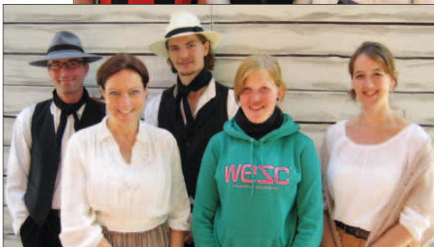
Befolkning, indianer, dansere, kor m.m.: